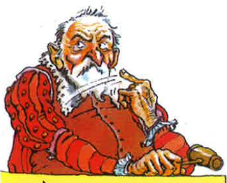
Don Fernando de Toledo, de hertog van Alva, richtte hier meteen een hele strenge rechtbank op, die de bijnaam "de bloedraad" kreeg omdat zoveel mensen erdoor ter dood veroordeeld werden.